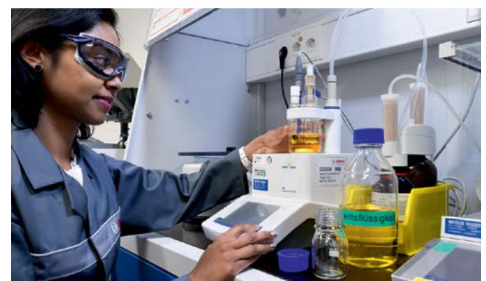
Resultados de las pruebas de Bosch ENV6 en el laboratorio: en el centro de desarrollo de Bosch de Abstatt se ha sometido a pruebas al líquido de frenos.

El líquido de frenos Bosch ENV6 se ha sometido a presiones extremas tanto en las rutinas de pruebas sobre la acumulación de presión del sistema a temperaturas extremas y en las pruebas de desgaste y de ruido.