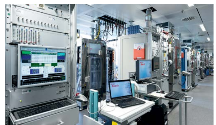
Bancos de pruebas de funcionamiento continuo en el laboratorio de alta tecnología: con su dinámica alta, ENV6 aporta un alto rendimiento y una vida útil larga a los sistemas de frenos modernos.