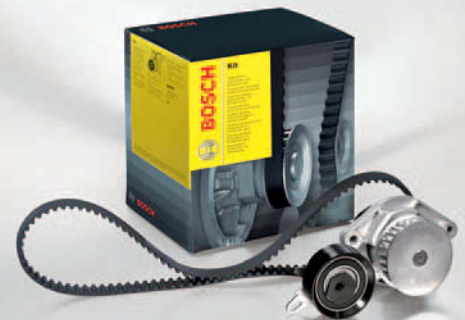
Kit con bomba de agua