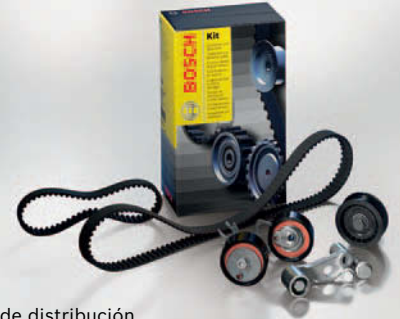
Kit de distribución