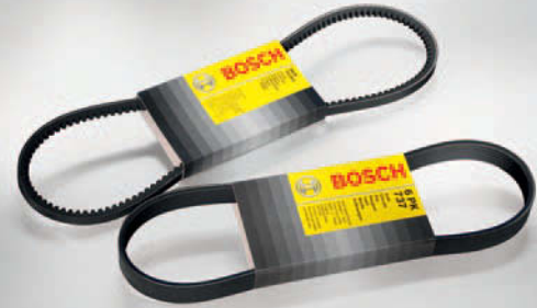
Correas nervadas y dentadas

Está reservado el derecho a efectuar cambios de naturaleza técnica y a modificar la gama de productos.