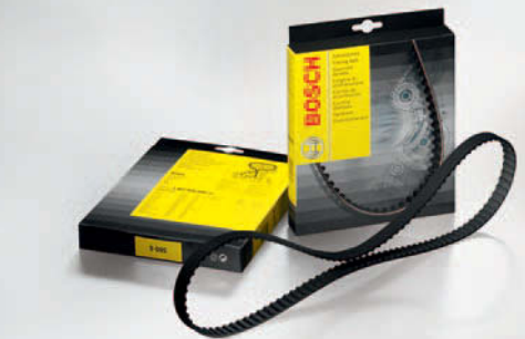
Correas de distribución