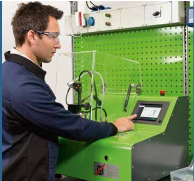
Sencillo manejo con pantalla táctil, incluso sin experiencia previa en comprobación de inyectores diesel

Los sistemas "common rail" en motores diesel siguen en crecimiento.