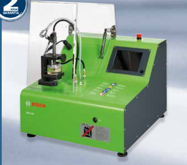
EPS 118: Robusto y de reducido tamaño con cámara de inyección transparente